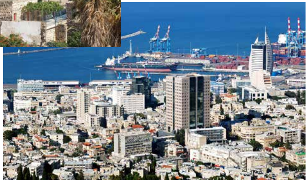
Haifa und Hafen